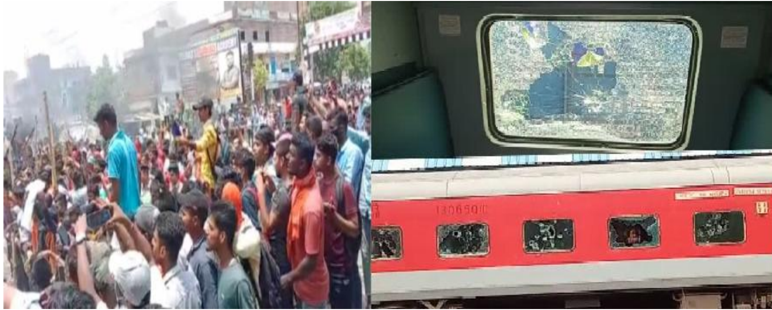
1. प्रदर्शन करते आक्रोशित युवा, 2. क्षतिग्रस्त ट्रेन