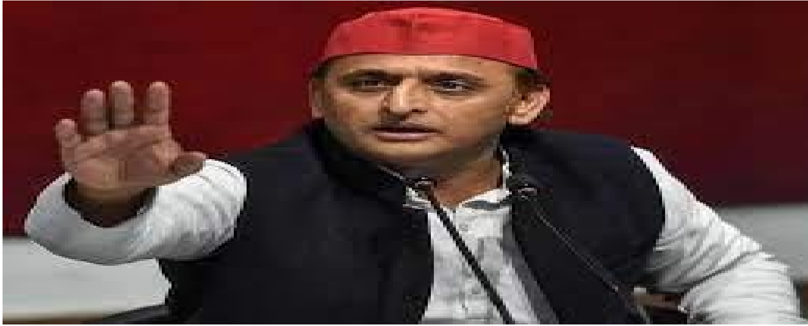
समाजवादी पार्टी के राष्ट्रीय अध्यक्ष अखिलेश यादव