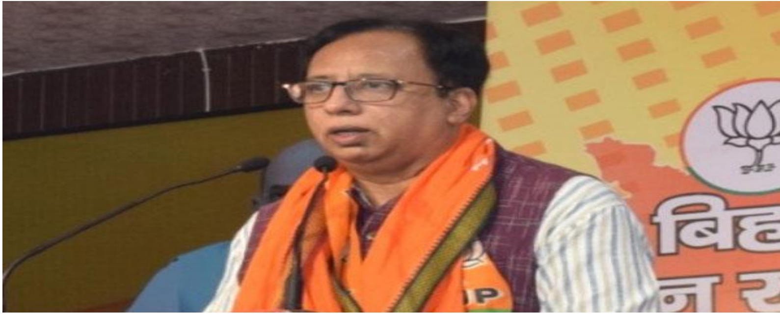
भाजपा प्रदेश अध्यक्ष डॉ संजय जायसवाल