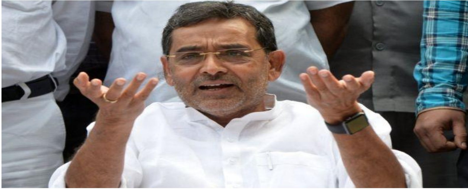
जदयू संसदीय बोर्ड के अध्यक्ष उपेंद्र कुशवाहा