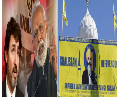
टूडो और मोदी ! जामने सामने !! हरदीप निज्जर : पंजाबदोही खालिस्तानी.

टूडो पर विपदा आसन्न है। पतन दिख रहा है। भारत से यारी संजोये अथवा अपनी अल्पमत वाली सरकार बचाए? कनाडा के इस 23वें प्रधानमंत्री जस्टिन जेम्स पाएरे ट्रूडो के समक्ष तीसरा विकल्प नहीं है। संसद के 338 सदस्यों में उनकी लिबरल पार्टी के 158 सांसद हैं। समर्थक सिखों की न्यू डेमोक्रेटिक पार्टी के 25 हैं। कनाडियन सिख खालिस्तान के हमदर्द हैं। तो यही है भारत-कनाडा झंझट का सार। सिखों की पार्टी की भूमिका वैसी ही है जो तमिलनाडु की द्रविड़ पार्टियों की थी। अप्रैल 1999 में जयललिता ने अपनी अन्ना-द्रमुक पार्टी का समर्थन खींच लिया था। अटल बिहारी वाजपेयी की सरकार अल्पमत में आ गई। ठीक वही दुर्दर्शा सरदार मनमोहन सिंह की संप्रग सरकार के द्रमुक नेता एमके करुणानिधि ने कर दी थी 19 मार्च 2013 को। तब श्रीलंका के तमिल