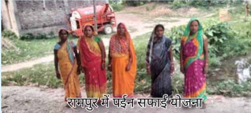
रामपुर में पईन सफाई योजना