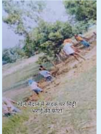
खेत मैदान में सड़क पर मिट्टी भराई की फोटो