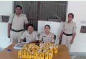
जप्त शराब के साथ पुलिसकर्मी