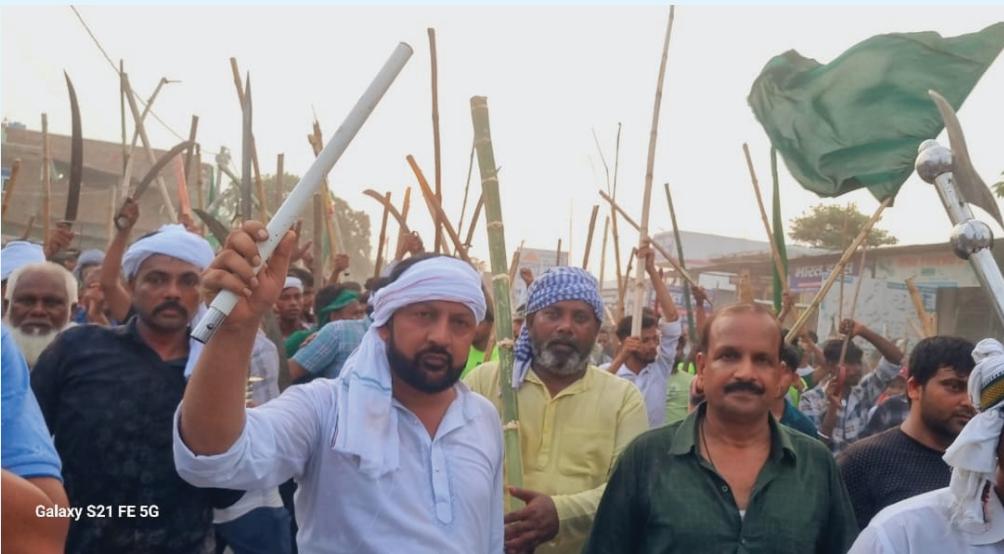
Galaxy S21 FE 5G