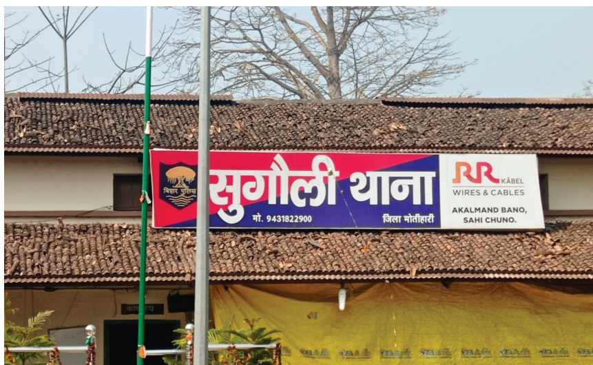
बीएनएम। पूर्वी चंपारण

पूर्वी चंपारण, 28 जुलाई (हि.स.)। जिले के सुगौली थाना क्षेत्र में बीती रात एक प्राचीन मंदिर से चोरी ने अष्टधातु से निर्मित राम जानकी की मूर्ति चोरी कर ले गए। सूचना मिलने के बाद मौके पर पहुंची पुलिस मामले की जांच में जुटी है। घटना सुगौली के भट्टाई टिकुलिया रामजानकी मठ की है। मठ के महंत ने रविवार को बताया कि वह मंदिर के बाहर सो रहे थे। सुबह में जब मंदिर में पूजा करने के लिए गए तो देखा