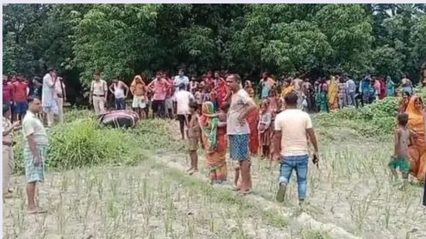
बीएनएम। पूर्वी चंपारण

जिले के पिपरा थाना क्षेत्र में बाइक सवार अपराधियों ने दिनदहाड़े एक व्यवसायी की गोली मार कर हत्या कर दी। बताया जा रहा है, कि व्यवसायी अपने कुल छह अष्टधातु की मूर्ति 1967 में स्थापित की गई थी जिसकी कीमत करीब दस लाख से ज्यादा की होगी। फिलहाल पुलिस इस मामले की छानबीन में जुटी है।