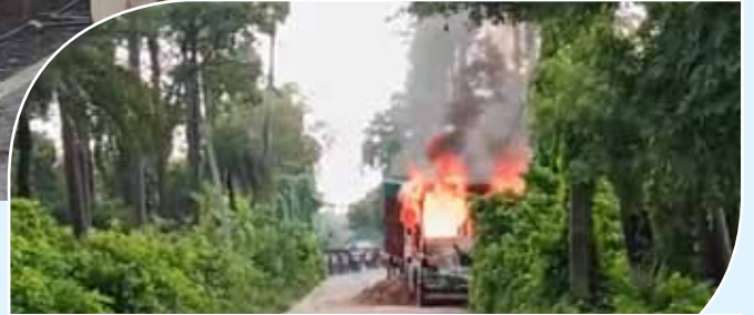
धू-धू कर जलता ट्रक