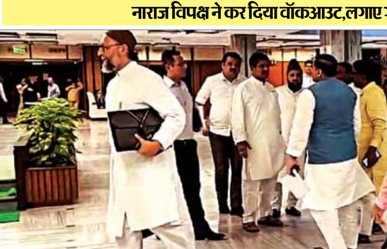
नाराज विपक्ष ने कर दिया वॉकआउट, लगाए गंभीर आरोप

नई दिल्ली (एजेंसी)। वक्फ (संशोधन) विधेयक 2024 को लेकर संयुक्त संसदीय समिति की बैठक में एक बार फिर पक्ष और विपक्ष के नेताओं के बीच टकराव देखने को मिला। विपक्षी नेताओं का कहना है कि बीजेपी के एक सदस्य ने उनपर आपत्तिजनक टिप्पणी की है। इसके बाद विपक्ष के नेताओं ने वॉकआउट कर दिया। इससे पहले सोमवार को भी विपक्ष के नेताओं ने वॉकआउट कर दिया था। बैठक के दौरान बीजेपी सांसद निशिकांत दुबे, दिलीप सैकिया, अभिजीत गांगुली और टीएमसी सांसद कल्याण बरजी, कांग्रेस के गौरव गोरोई के बीच तीखी बहस हो गई। वक्फ बोर्ड में महिलाओं को शामिल करने को लेकर इन लोगों में तीखी बहस हुई। विपक्षी नेताओं का