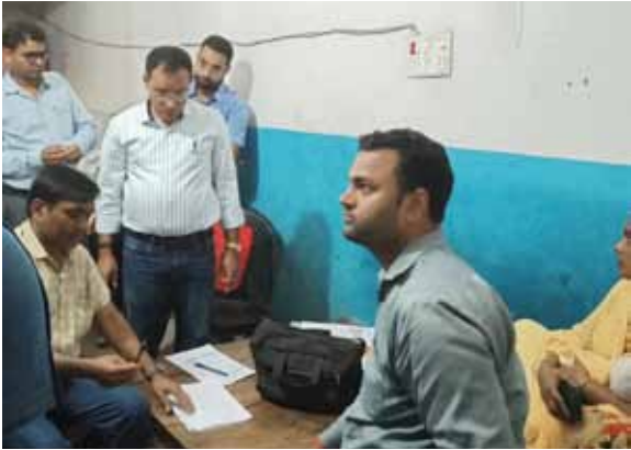
Drug Control Department Raids caused a stir