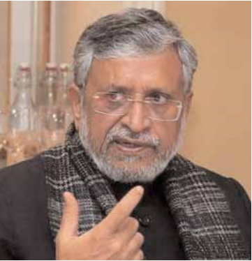
फुर्सत नहीं मिली।

पटना, एजेंसी। पूर्व उप मुख्यमंत्री सुशील कुमार मोदी ने आरोप लगाया है कि राजद सुप्रीमो लालू प्रसाद ने हजार करोड़ की बेनामी सम्पति के मामले में घिरे अपने दोनों बेटों को बचाने के लिए पार्टी के दो बड़े नेताओं को केन्द्र सरकार के दो मंत्रियों से गुहार लगाने के लिए दिल्ली भेजा। उन्होंने दावा किया कि राजद के इन नेताओं को केन्द्र के मंत्रियों के इनकार के बाद निराशा हाथ लगी। शुक्रवार को अपने बयान में श्री मोदी ने कहा कि राष्ट्रपति पद के यूपीए उम्मीदवार मीरा कुमार के नामांकन कार्यक्रम में घटक दल के तमाम बड़े नेता नदारद थे। उन्होंने कहा कि सोनिया गांधी इस हारी हुई प्रतीकात्मक लड़ाई को सैद्धांतिक बता रही हैं जबकि नामांकन में ममता बनर्जी, अखिलेश यादव, लालू प्रसाद, मायावती से लेकर चौधरी अजित सिंह तक शामिल नहीं हुए। कहा कि लालू प्रसाद ने तो दो कनिष्ठ मंत्री को भेजकर रस्म पूरा किया। श्री मोदी ने कहा कि यह कैसी सिद्धांत की लड़ाई है कि एक महीने से विदेश में छुट्टी मनाने गए कांग्रेस उपाध्यक्ष राहुल गांधी को भी नामांकन में शामिल होने की