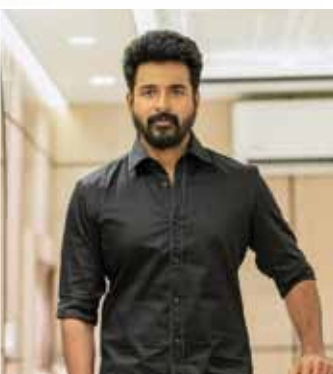
राजकुमार पेरियासामी द्वारा निर्देशित एक्शन फिल्म अमरन का मोस्ट अवेटेड रिलीज किया गया था जो दर्शकों को एक इमोशनल और

देशभक्ति से भरपूर कहानी पेश करता है। राज कमल फिल्म्स इंटरनेशनल द्वारा निर्मित, फिल्म में मेजर मुकुंद वरदराजन का रोल शिवकार्तिकेयन प्ले कर रहे हैं साथ ही साई पल्लवी, भुवन अरोड़ा, राहुल बोस जैसे शानदार कलाकार सपोर्टिंग रोल में हैं। अमरन शिव अरुर और राहुल सिंह की बुक सीरीज इंडियाज मोस्ट फियरलेस: टू स्टोरीज ऑफ मॉडर्न मिलिट्री का रूपांतरण है, जो मेजर वरदराजन की बहादुरी पर केंद्रित है। ट्रेलर में जबरदस्त एक्शन सीन और इमोशनल पल है जो देशभक्ति और प्यार के बीच चलने वाले उतार चढ़ावों को दिखाता है। अमरन की स्टोरी वास्तविक जीवन की घटनाओं