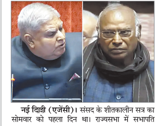
नई दिल्ली (एजेंसी)। संसद के शीतकालीन सत्र का सोमवार को पहला दिन था। राज्यसभा में सभापति

संसद के शीतकालीन सत्र का पहला दिन सभापति ने कहा- आप अनुभवी, सदन की मर्यादा रखें; खड़गे बोले- मुझे मत सिखाइए