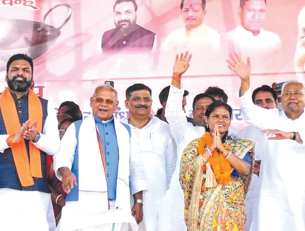
फीसदी आरक्षण से देश के किसी राज्य से बिहार में महिला पुलिसकर्मियों की संख्या ज्यादा है।

गया, एजेंसी। मुख्यमंत्री नीतीश कुमार ने कहा है कि अगले विधानसभा चुनाव से पहले 34 लाख लोगों को नौकरी और रोजगार मिल जाएगा। वर्ष 2020 में दस लाख नौकरी और इतनी संख्या में रोजगार देने की बात हमने कही थी। इनमें सात लाख 17 हजार को नौकरी मिल गयी है। 2025 चुनाव से पहले 12 लाख को सरकारी नौकरी भी मिल जाएगी। उन्होंने यह भी कहा कि 24 लाख को अब-तक रोजगार दे चुके हैं। सीएम रविवार को गया के बेलगांज में जदयू उम्मीदवार मनोरमा देवी और इमामगंज से हम की उम्मीदवार दीपा मांडी के पक्ष में चुनावी सभा को संबोधित कर रहे थे। बेलगांज और इमामगंज दोनों की सभाओं में उन्होंने 2005 से किए गए काम गिनाए। बताया कि 2005 से पहले किस तरह शाम के बाद लोगों का निकलना मुश्किल हो जाता था। हिन्दू-मुस्लिम के नाम पर लड़ाई होती थी। बिजली, सड़क, स्वास्थ्य और शिक्षा की स्थिति कितनी खराब थी। इसे भूलियेगा नहीं। उन्होंने कहा कि अब हिन्दू-मुस्लिम की लड़ाई नहीं होती। आठ हजार से ज्यादा कश्मिरान की घेराबंदी करायी। वहीं 60 साल से ज्यादा पुराने मंदिरों की घेराबंदी का काम भी शुरू हुआ है। मदरसों को सरकारी मान्यता दी गई। सीएम ने कहा कि पुलिस में महिलाओं के 35