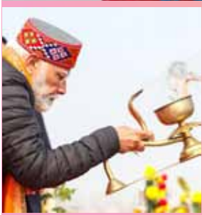
Agency: Prime Minister Narendra Modi on Wednesday visited Prayagraj, where he took a holy dip at Prayagraj's

Triveni Sangam on the auspicious occasions of Magh Ashtami and Bhishma Ashtami. Dressed in a saffron sweatshirt and tracksuit, PM Modi offered prayer at Triveni Sangam holding rudraksha beads, chanting sanskrit mantras, before offering aarti wearing a navy blue kurta, black jacket and a Himachali woollen cap. After performing the ritual bath, PM Modi is on his way to address a gathering