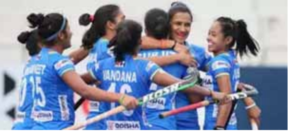
फिलक की सटीकता में सुधार करना था। भारतीय महिला टीम के मुख्य कोच हरेन्द्र सिंह ने कहा कि शिविर खिलाड़ियों के लिए बहुत फायदेमंद रहा और ताइकेमा लॉस एंजिल्स खेलों तक अल्पकालिक आधार पर टीम के साथ काम करना जारी रखेंगे। उन्होंने कहा, “ताइकेमा ड्रैग फिलक के मामले में सबसे महान दिग्गजों में से एक हैं। वह तकनीक को निखारने और ड्रैग फिलक की प्रक्रिया को आसान बनाने के लिए टीम के साथ काम कर रहे हैं।”

नई दिल्ली। भारतीय महिला हॉकी टीम 2028 लॉस एंजिल्स ओलंपिक के लिए अभी से तैयारियों में लगी है। हॉकी इंडिया ने टीम की तैयारियों के लिए नीदरलैंड के दिग्गज ड्रैग फिलक ताइके ताइकेमा से भी करार किया है। इसी के तहत ताइकेमा टीम की इस कमजोरी को भी टीम करने में लगे हैं। ताइकेमा ने पिछले महीने भुवनेश्वर में प्रो लीग से पहले सात दिवसीय शिविर में भी भारतीय खिलाड़ियों को प्रशिक्षण दिया था। भारत ने प्रो लीग के घरेलू चरण में इंग्लैंड, जर्मनी, नीदरलैंड और स्पेन के खिलाफ अच्छा प्रदर्शन किया था। ताइकेमा के मार्गदर्शन में शिविर का मुख्य उद्देश्य तकनीकी कौशल को निखारने के साथ ड्रैग