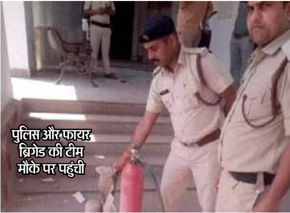
पुलिस और फायर ब्रिगेड की टीम मौके पर पहुंची