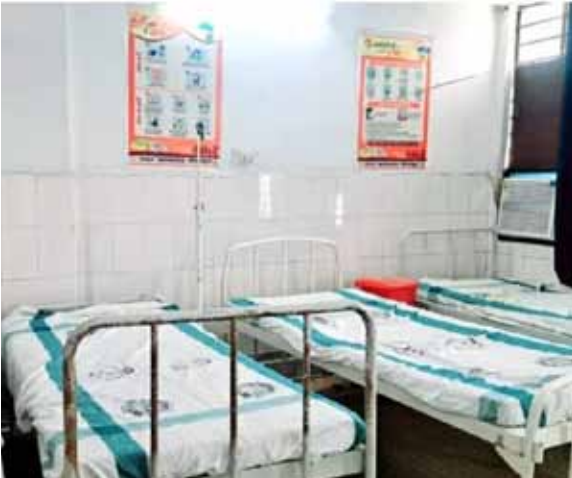
सदर अस्पताल में तैयार बेड

जिले में भीषण गर्मी और लू असर लगातार बढ़ती जा रही है. सदर अस्पताल में लू से पीड़ित मरीजों के लिए 10 बेड का वातानुकूलित विशेष वार्ड बनाया गया है. बरबीधा रेफरल अस्पताल में 20 बेड का ऐसा ही वार्ड तैयार किया गया है. दोनों जगह पर सभी जरूरी सेवाएं और दवाई का व्यवस्था की जा चुकी है जबकि मरीजों की देखभाल के लिए डॉक्टर को 24 घंटे इश्ट्री पर तैनात रखने का निर्देश दिया गया है. अपर मुख्य चिकित्सा पदाधिकारी डॉ अशोक कुमार सिंह ने कहा है कि तापमान लगातार बढ़ रहा है. ऐसे में लोगों को सावधानी बरतनी होगी उन्होंने सलाह दिया है कि सुबह 10:00 बजे से दोपहर 3:30 तक बिना जरूरी काम के घर से बाहर न निकले. वहीं बरबीधा रेफरल