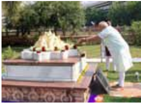
He visited the memorial for