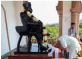
the first time after becoming