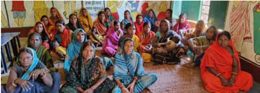
महिला दिवस पर सशक्तिकरण को लेकर जागरूकता बैठक