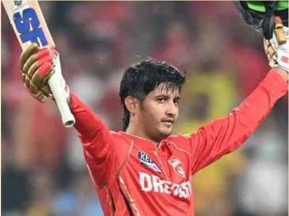
दमदार खिलाड़ी है।”