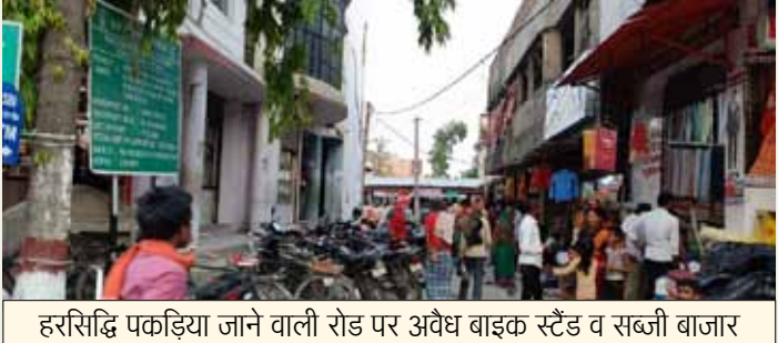
हरसिद्धि पकड़िया जाने वाली रोड पर अवैध बाइक स्टैंड व सब्जी बाजार

सड़क पर दुकानें लगने से पूरे बाजार क्षेत्र में वाहनों की आवाजाही बुरी तरह प्रभावित हो रही है। सुबह और शाम के समय भारी जाम लग रहा है। स्कूली बच्चों, ऑफिस