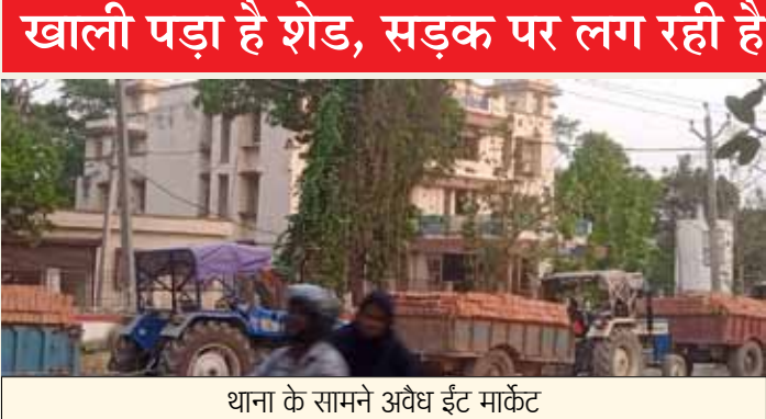
थाना के सामने अवैध ईट मार्केट

जिले के हरसिद्धि बाजार इन दिनों अराजकता और अव्यवस्था का प्रतीक बनता जा रहा है। दुकानदारों के लिए बनाए गए आधुनिक शेड जहां खाली पड़े हैं, वहीं मुख्य सड़कों पर अवैध रूप से दुकाने सजाकर व्यापार किया जा रहा है। आलम यह है कि पैदल चलने वालों को बाजार में कदम रखने तक की जगह नहीं मिल रही है। ट्रैफिक जाम और गंदगी ने लोगों का जनजीवन दुभर कर दिया है। वहीं सरकारी स्तर से लाखों रुपये खर्च कर दुकानदारों के लिए शेड तैयार करवाए गए हैं ताकि बाजार में सुव्यवस्थित व्यापार हो सके और सड़कें अतिक्रमण से मुक्त रहें। लेकिन शेड को छोड़कर अधिकांश दुकानदारों ने सड़क को ही अपना ठिकाना बना लिया है। जिससे यातायात प्रभावित हो जाती है। प्रशासनिक उदासीनता का आलम यह है कि बार-बार, शिकायतों के बावजूद