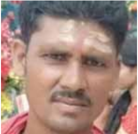
मजदूर की फाइल फोटो

से घायल है। मामले की जांच की जा रही है और कानूनी प्रक्रिया के तहत कार्रवाई की जा रही है।”यह हादसा स्थानीय प्रशासन और सरकार के उन दावों पर सवाल खड़ा करता है जिसमें सड़कों के बेहतर रखरखाव की बात की जाती है। हादसे की मुख्य वजह सड़क किनारे मौजूद गहरे गड्ढे को माना जा रहा है, जो समय रहते भरा नहीं गया।स्थानीय लोगों ने प्रशासन से मांग की है कि इस मार्ग की तत्काल मरम्मत कराई जाए ताकि भविष्य में ऐसे हादसे न