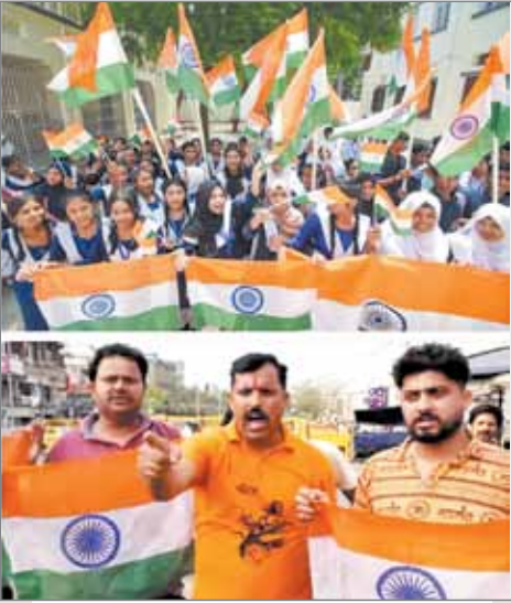
एयर स्ट्राइक की खुशी में लोगों ने जश्न मनाया