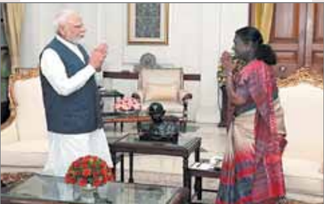
पीएम मोदी राष्ट्रपति मुर्मू से मिलने के लिए राष्ट्रपति भवन पहुंचे। पीएम ने राष्ट्रपति की ऑपरेशन सिंदूर पर जानकारी दी।