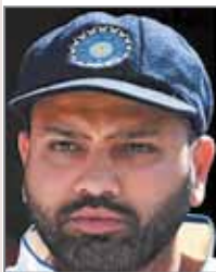
रेड बॉल क्रिकेट को अलविदा कह दिया।

इंग्लैंड दौरे पर कप्तानी से हटाए जाने की अटकलें थीं; वनडे खेलना जारी रखेंगे