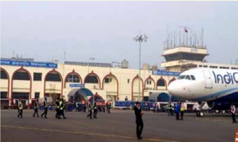
जयप्रकाश नारायण अंतरराष्ट्रीय एयरपोर्ट, पटना

पाकिस्तान के आतंकी ठिकानों पर भारतीय सेना द्वारा की गई जवाबी एयर स्ट्राइक ‘ऑपरेशन सिंदूर’ के बाद देश के कई एयरपोर्ट्स पर सुरक्षा बढ़ा दी गई है। जम्मू-कश्मीर, पंजाब, राजस्थान और हिमाचल प्रदेश के 11 एयरपोर्ट्स पर उड़ानें अस्थायी रूप से रद्द की गई हैं। पटना एयरपोर्ट पर भी सुरक्षा के मद्देनजर अतिरिक्त उपाय किए गए हैं। एयरपोर्ट के हर कोने में सीआईएसएफ के जवानों की तैनाती की गई है और यहां हर गतिविधि पर कड़ी निगरानी रखी जा रही है।ऑपरेशन सिंदूर के असर के कारण अब तक पटना एयरपोर्ट से चार फ्लाइट्स को रद्द किया गया है। इंडिगो की फ्लाइट संख्या 6E 6485, जो भुवनेश्वर से 1:25 बजे पटना आनी थी, रद्द कर दी गई। वहीं, फ्लाइट संख्या 6E 6394, जो चंडीगढ़ से सुबह 9:15 पर पटना आने वाली थी, उसे भी रद्द किया गया। इसके अलावा, पटना से जाने वाली फ्लाइट्स में भी बदलाव हुआ। इंडिगो की फ्लाइट 6E 6394,