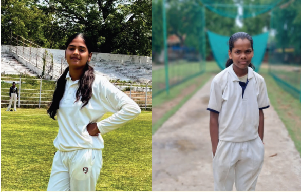
चयनित दोनों खिलाड़ियों की तस्वीर