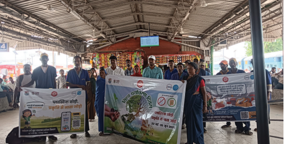
किउल स्टेशन पर निकाली गई स्वच्छता मार्च

रखने के लिए भी कहा। सीएचआई ने बताया कि यह अभियान 5 जून तक चलेगा जिसमे अलग अलग तरीको से लोगों को पर्यावरण संरक्षण के लिए जागरूक किया जाएगा। उन्होंने लोगों को प्लास्टिक मुक्त वातावरण बनाने की अपील किया और कहा कि अगर कोई सामग्री की खरीददारी करते है तो कपड़ो का थैला का