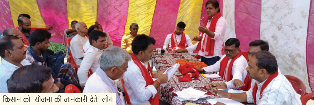
किसान को योजना की जानकारी देते लोग