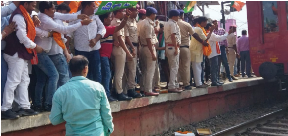
ट्रेन से नहीं उतरे रेल मंत्री इंतजार करते रहे गये कार्यकर्ता