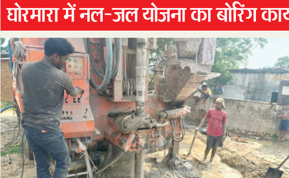
नल-जल योजना के बोरिंग कार्य में जुटे मजदूर और ग्रामीण