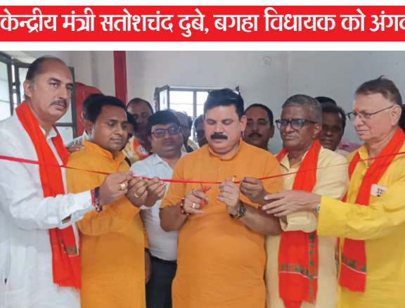
फीता काटकर कार्यालय का उद्घाटन करते विधायक