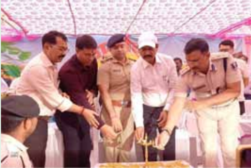
दीप प्रज्वलित कर कार्यक्रम का उद्घाटन करते हैं अधिकारी