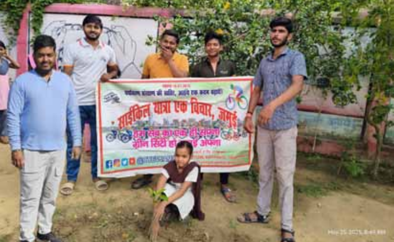
पौधारोपण करते छात्र का समूह