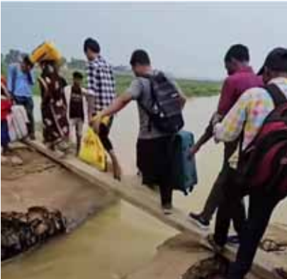
जान जोखिम में डालकर किऊल स्टेशन से लखीसराय आते लोग

किऊल नदी पर बने अस्थायी पुल के अप्रोच पथ का एक हिस्सा दो दिन पहले तेज बारिश और नदी के तेज बहाव में बह गया, जिससे लखीसराय नगर और किऊल स्टेशन के बीच आवागमन पूरी तरह बाधित हो गया। इस अस्थायी पुल से रोजाना करीब 50 हजार से अधिक लोग आना-जाना करते हैं, जिसमें छात्र, नौकरीपेशा, व्यवसायी और ग्रामीण शामिल हैं। स्थिति की गंभीरता को देखते हुए जिलाधिकारी मिथलेश मिश्र के निर्देश पर नगर परिषद ने तत्काल मरम्मत कार्य शुरू कर दिया है। नगर परिषद की टीम मौके पर मौजूद है और युद्धस्तर पर कार्य जारी है। अधिकारियों ने बताया कि जैसे ही जलस्तर में थोड़ी गिरावट आती है, टूटे हिस्से को जोड़ने का काम तेजी से किया जाएगा। इस अस्थायी