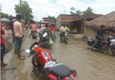
सड़क पर जमा बारिश का पानी

जिला अंतर्गत प्रखंड बगहा दो की चमवलिया पंचायत में खिरिया मछरगांवा गांव वार्ड संख्या 7 में सड़क का अतिक्रमण कर लिया गया है। वही एक तरफ जहां नाला भरा पड़ा है। नल की कोई सफाई नहीं होने के कारण हल्की बारिश होते ही सड़क पर जल जमा हो गया है, जिसे आवागमन बाधित हो रहा है । दूसरी तरफ ग्रामीणों के द्वारा सड़क के किनारे बांध बनाकर जल जमाव के निकासी का मार्ग रोक दिया गया है और सड़क नाले के रूप में तब्दील हो गई है। इस पर ग्रामीणों के द्वारा पटखौली थाना को सूचित किया गया था । इसमें पाटखौली थाना के द्वारा सड़क से जल निकासी के लिए बांध को तुड़वा दिया गया था और जल निकासी कराया गया था। परंतु दूसरी तरफ पाटखौली थाना की पुलिस को जाते