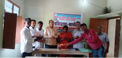
दीप प्रज्वलित कर प्रशिक्षण कार्यक्रम का शुरुआत अतिथि

राष्ट्रीय कृषि व ग्रामीण विकास बैंक (नाबाई ) संपोषित एफपीओ अभिलाषा फिशरी फार्मर प्रोड्युसर कंपनी लिमिटेड के सीईओ व निदेशकों के पांच दिवसीय प्रशिक्षण कार्यक्रम का शुभारम्भ मंगलवार को बैरिया प्रखंड क्षेत्र शुरुआत अतिथि