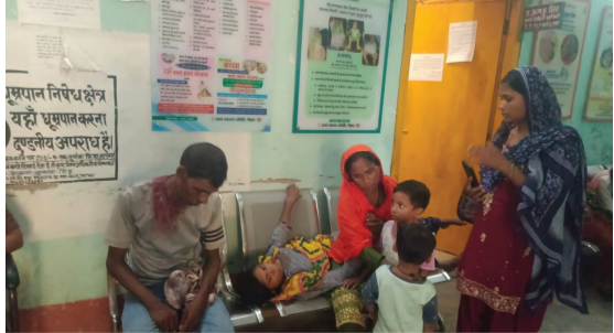
झाझा रेफरल अस्पताल में इलाजरत