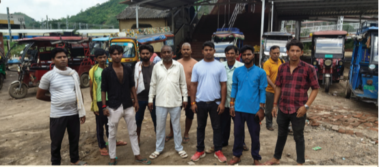
बैठक में शामिल ई रिक्शा चालक