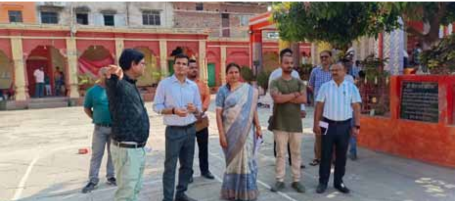
स्थल निरीक्षण, करते नगर आयुक्त व महापौर

महापौर गरिमा देवी सिकारिया ने बताया कि छह फेज में होने वाले ‘माँ कालीधाम कोरिडोर’ के निर्माण को लेकर 3.25 करोड़ से फर्स्ट फेज और 3.30 करोड़ से दूसरे फेज के डीपीआर की की प्रशासनिक स्वीकृति नगर निगम बोर्ड से मिलने के बाद काम शुरू करने की पहल तेज कर दी गई है। कुल 6.55 करोड़ की लागत से दोनों फेजों के कार्य के द्वारा ‘माँ कालीधाम कोरिडोर’ बनाने की शुरुआत की जाएगी। नगर निगम बोर्ड से डीपीआर के प्रथम दो प्रारूप को प्रशासनिक स्वीकृति मिल जाने