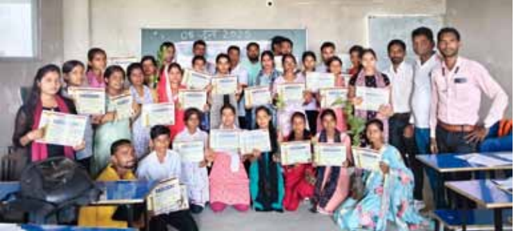
क्विज प्रतियोगिता के शामिल छात्र-छात्रायें