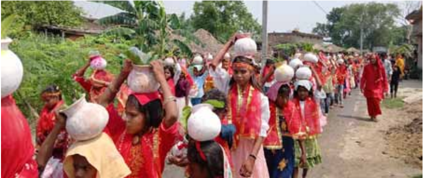
कलश यात्रा में शामिल श्रद्धालु

प्रखंड क्षेत्र के लौकरिया में रविवार की सुबह में श्री रुद्र महायज्ञ को लेकर कलश यात्रा निकाली गई । इस कलश यात्रा में श्रद्धालुओं की भारी भीड़ उमड़ पड़ी। 2501 कुंवारी कन्याओं ने अपने माथे पर कलश लेकर लौकरिया के विभिन्न गांवों से होते हुए गंडक के घाट पर पहुंच कर वैदिक मंत्रोच्चारण के बाद जल भरी। उस दौरान पुरा पंचायत भक्तिमय हो गया।हालाकि इस चिलचिलाती धूप में भी आस्था भारी पड़ा।दूर दूर से आए श्रद्धालुओ ने इस कलश यात्रा में शामिल रहे।जिस रास्ते से कलश यात्रा निकाल रहा था। उस रास्ते पर पानी पटाकर उंडा किया जा रहा था। जगह –जगह श्रद्धालुओ के द्वारा सीतल पेजल और शरबत