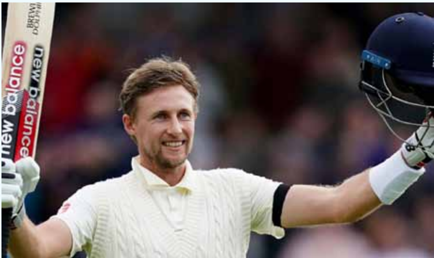
टेस्ट में सबसे ज्यादा रन बनाने वाले बल्लेबाज बन गए हैं। उन्होंने रवींद्र जडेजा के खिलाफ कुल 588 रन बना लिए हैं, जो किसी भी बल्लेबाज

मैनचेस्टर। भारत और इंग्लैंड के बीच चौथे टेस्ट मैच के तीसरे दिन जो रूट ने अपनी क्लासिक बल्लेबाजी से इतिहास रच डाला। 248 गेंदों में 150 रन की इस जबरदस्त पारी के दौरान उन्होंने एक नहीं, बल्कि कई दिग्गजों के रिकॉर्ड तोड़ दिए। रूट ने न केवल राहुल द्रविड़, रिकी पॉटिंग और जैक कैलिस जैसे महान खिलाड़ियों को पीछे छोड़ा, बल्कि श्रीलंका के कुमार संगकारा के 38 टेस्ट शतकों की बराबरी भी कर ली। यह उनका भारत के खिलाफ 12वां टेस्ट शतक था, जो इस बात को दर्शाता है कि वह भारतीय आक्रमण के खिलाफ कितने प्रभावशाली रहे हैं। हालांकि इस शतक के दौरान एक ऐसा रिकॉर्ड भी बना, जो भले ही ज्यादा चर्चा में न रहा हो, लेकिन टेस्ट क्रिकेट के इतिहास में अपनी अहम जगह रखता है। रूट अब एक गेंदबाज के खिलाफ