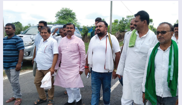
बगहा वोट अधिकार यात्रा की तैयारी में जुटे कार्यकर्ता