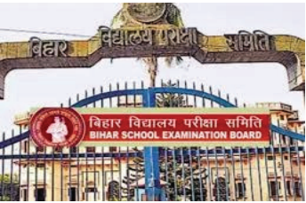
चयन प्रक्रिया पूरी तरह पारदर्शी

बिहार विद्यालय परीक्षा समिति (BSEB) ने बड़ी भर्ती प्रक्रिया शुरू की है, जिसमें हजारों अभ्यर्थियों को रोजगार का अवसर मिलेगा। इस बहाली में सबसे अहम बात यह है कि भूतपूर्व सैनिकों को आयु सीमा में विशेष छूट दी गई है। समिति ने स्पष्ट किया है कि भूतपूर्व सैनिकों को अधिकतम तीन वर्ष की अतिरिक्त छूट के साथ-साथ उतनी अवधि का लाभ भी मिलेगा, जितना समय उन्होंने सेना में सेवा की है। हालांकि, आवेदन की अंतिम तिथि तक उनकी उम्र 57 वर्ष से अधिक नहीं होनी चाहिए।भूतपूर्व सैनिकों के लिए यह शर्त भी रखी गई है कि वे सेवा का प्रमाण-पत्र प्रस्तुत करेंगे, तभी उन्हें आरक्षण और आयु छूट का लाभ मिल सकेगा। यह प्रावधान उन युवाओं के लिए बड़ी राहत है जो सेना से सेवा निवृत्त होने के बाद भी सरकारी नौकरी की तलाश में हैं।