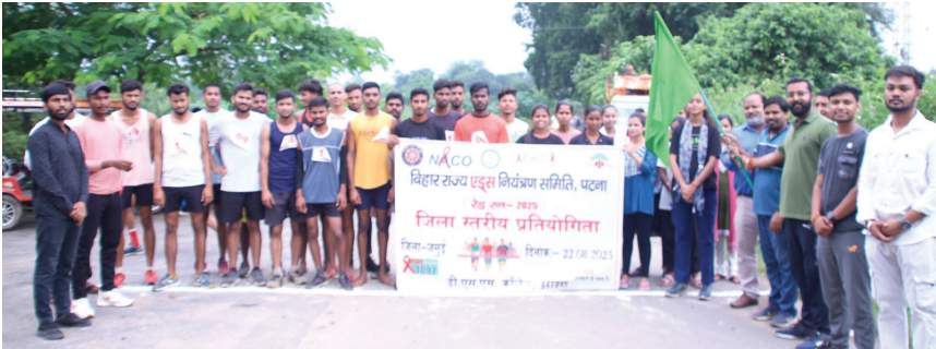
जमुई मैराथन दौड़ में भाग लेते प्रतिभागी