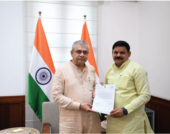
बगहा रेल मंत्री को पत्र देते राज्य मंत्री

केंद्रीय कोयला एवं खान राज्य मंत्री, भारत सरकार, सतीश चंद्र दुबे ने रेल मंत्री अश्विनी वैष्णव से मुलाकात कर पश्चिम चम्पारण की जनता के लिए बेहतर रेल सुविधाओं से जुड़े कई महत्वपूर्ण मुद्दा उठाया है। राज्यमंत्री ने रेल मंत्री से स्थानीय निवासियों की जरूरतों पर तत्काल कार्रवाई करने का आग्रह करते हुए निम्नलिखित प्रमुख मांगें रखीं। सबसे पहले सिकटा स्टेशन पर अमृत भारत ट्रेन का ठहराव स्वीकृत करने के लिए रेल मंत्री का हार्दिक धन्यवाद देकर इसी स्टेशन पर आनंद बिहार टर्मिनल जाने वाली स्पेशल एक्सप्रेस ट्रेन के ठहराव की मांग की, ताकि दिल्ली जाने वाले यात्रियों को और अधिक सुविधा मिल सके।पश्चिमी चंपारण के वाल्मीकिनगर लोकसभा क्षेत्र में 9 महत्वपूर्ण रेलवे फाटकों पर ओवरब्रिज बनाने की मांग की , ताकि ट्रैफिक जाम की गंभीर