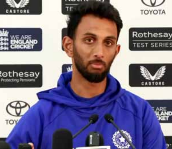
कहा है कि मैदान के बाहर रूट से उनकी अच्छी दोस्ती है। कृष्णा ने रूट के साथ हुई बहस पर कहा, यह एक छोटी सी बात थी, एक प्रतिस्पर्धात्मक बढ़त। वहीं कृष्णा ने मुख्य तेज

ओवल । भारतीय क्रिकेट टीम के तेज गेंदबाज प्रसिद्ध कृष्णा और इंग्लैंड के अनुभवी बल्लेबाज जो रूट के बीच यहां इंग्लैंड के खिलाफ हुए पांचवें टेस्ट मैच के दूसरे दिन तीखी बहस हो गयी। इसा दौरान अंपायर ने हस्तक्षेप करते हुए कृष्णा को शांत कराया। इंग्लैंड की पारी के 22वें ओवर का ये मामला है तब रूट को गेंद डालने के बाद कृष्णा ने कुछ कहा। इसके बाद अंपायर बीच में आये। रूट आम तौर पर अपनी बल्लेबाजी पर ध्यान देते हैं और विवादों से दूर रहते हैं पर इस बार वह भी भड़क गये। वहीं कृष्णा ने दिन का खेल समाप्त होने पर इसे अच्छी लड़ाई बताया है और