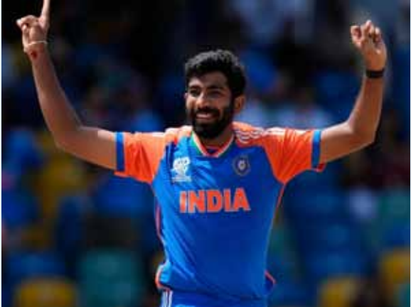
वह बाहर हैं। डोइशे ने कहा कि बुमराह जैसे खिलाड़ी के बिना उतरना हमेशा ही कठिन रहता है। उन्होंने कहा, 'बुमराह का

लंदन । भारतीय क्रिकेट टीम के सहायक कोच रेयान टेन डोइशे ने कहा है तेज गेंदबाज जसप्रीत बुमराह के आराम लेने से किसी को भी समस्या नहीं होनी चाहिये। डोइशे ने कहा कि बुमराह को अधिकार है कि वह ये तय करें कि उन्हें कितने मैच खेलने हैं। बुमराह ने इंग्लैंड के खिलाफ सीरीज में तीन टेस्ट ही खेले हैं और सीरीज की शुरुआत में ही उन्होंने ये घोषणा कर दी थी। बुमराह ने पहला टेस्ट खेला पर वह दूसरे टेस्ट से बाहर रहे। इसके बाद लॉर्डस और ओल्ड टैफर्ड में उन्होंने लगातार दो मैच खेले। वहीं अंतिम टेस्ट से भी