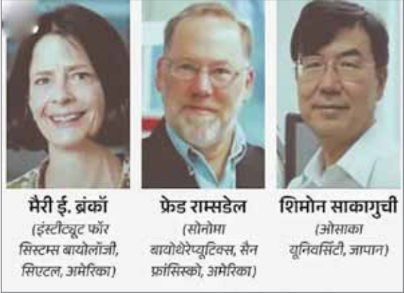
मैरी ई. ब्रंकों (इंस्टीट्यूट फॉर सिस्टम्स बायोलॉजी, सिएटल, अमेरिका)

स्टॉकहोम (एजेंसी)। वर्ष 2025 के चिकित्सा क्षेत्र के नोबेल पुरस्कार की घोषणा कर दी गई है। रॉयल स्वीडिश एकेडमी ऑफ साइंसेज ने सोमवार को फिजियोलॉजी या मेडिसिन के नोबेल पुरस्कार विजेताओं को नाम का ऐलान किया है। इस साल तीन वैज्ञानिकों- मैरी ई. ब्रूनको, फ्रेड रामस्टेल और शिमोन सकागुची को चिकित्सा क्षेत्र का नोबेल पुरस्कार मिला है। परिधीय प्रतिरक्षा सहिष्णुता (पेरिफेरल इम्यून टॉलरेंस) से संबंधित खोजों के लिए तीनों को नोबेल का मिला है। चिकित्सा के क्षेत्र में दिए जाने वाले नोबेल पुरस्कार को आधिकारिक तौर पर ‘फिजियोलॉजी या मेडिसिन’ का नोबेल पुरस्कार कहा जाता है। यह सम्मान 1901 से 2024 के बीच 115 बार 229 नोबेल पुरस्कार विजेताओं को प्रदान किया जा चुका है। पिछले साल का पुरस्कार अमेरिकी नागरिक विक्टर एम्बोस और गैरी रुवकुन को सूक्ष्म ‘आरएनए’ (राइबोन्यूक्लिक एसिड) की खोज के लिए दिया गया था।