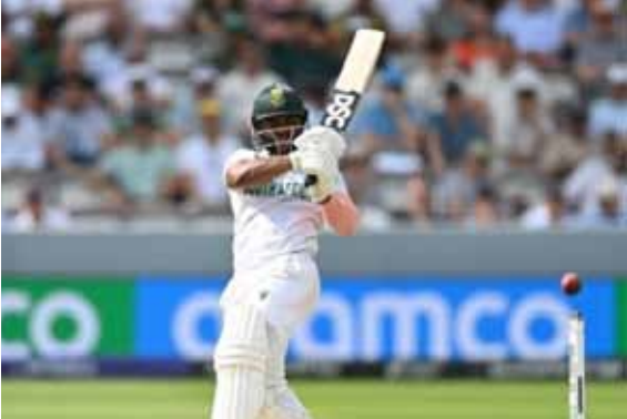
दक्षिण अफ्रीका ‘ए’ टीम का पूरा स्क्वांड

क्रिकेट साउथ अफ्रीका (सोएसए) ने गुरुवार को भारत दौरे के लिए अपनी ‘ए’ टीम की घोषणा कर दी। दौरे की शुरुआत 30 अक्टूबर से बेंगलुरु में दो चार दिवसीय अनऑफिशियल टेस्ट मैचों से होगी। दूसरा चार दिवसीय मैच 6 से 9 नवंबर तक खेला जाएगा। दोनों मुकाबले बीसीसीआई सेंटर ऑफ एक्सीलेंस में आयोजित किए जाएंगे। इसके बाद दोनों टीमों 13 से 19 नवंबर तक राजकोट में तीन मैचों की वनडे सीरीज खेलेंगी। यह दौरा साउथ अफ्रीका की सीनियर टीम के भारत दौरे से पहले का अभ्यास दौरा होगा। दक्षिण अफ्रीका के टेस्ट और डब्ल्यूटीसी विजेता कप्तान टेम्बा बावुमा चोट से उबरकर दूसरे अनऑफिशियल टेस्ट में वापसी करेंगे। वहीं, भारत ‘ए’ टीम की घोषणा अभी नहीं की गई है।