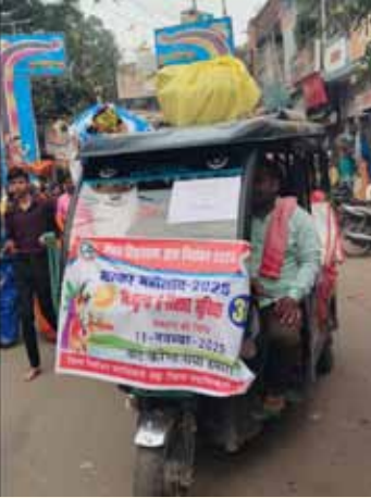
निशुल्क ई रिक्शा से जाते छठव्रती

दिव्यांगों के लिए इ- रिक्शा - प्रशासन ने दिव्यांग छठव्रतियों के लिए इस बार इ- रिक्शा की भी व्यवस्था की थी। यह पूरी तरह निः शुल्क सेवा थी। इसे विभिन्न