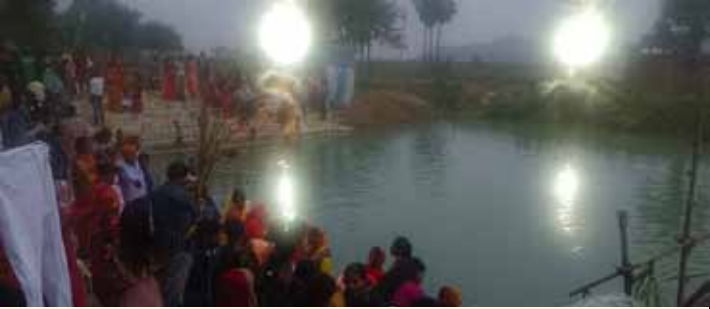
छठ घाट पर भीड़

एसएसपी भी अनाउंस करते रहें- डीएम और वरीय पुलिस अधीक्षक विभिन्न छठ घाटों पर टीम के साथ दिखे। भीड़ को नियंत्रित करने के लिए वे अनाउंस करते रहें। रस्सी से घेरे गये घाटों से आगे जाने वाले