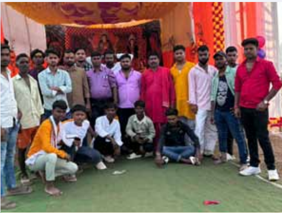
गणेशी मंदिर छठ घाट पर मौजूद समिति के लोग

की भीड़ प्रतिमा स्थल पर उमड़ पड़ी, जहां उन्होंने भगवान भास्कर और छठी मईया के दर्शन कर