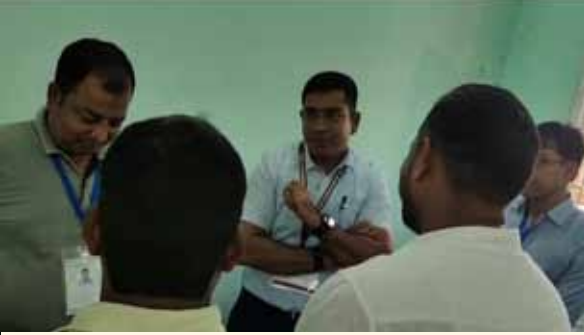
प्लास टू जिला स्कूल में मॉक ड्रिल में शामिल पदाधिकारी

गया शहर के प्रेक्षक सी समयामूर्ति ने मॉक ड्रिल का निरीक्षण किया। इस दौरान उन्होंने मॉक ड्रिल में भाग ले रहे सेक्टर पदाधिकारियों को चुनाव से संबंधित महत्वपूर्ण आवश्यक निर्देश भी दिए। उन्होंने सेक्टर पदाधिकारियों से मतदान से जुड़े कुछ सवाल भी पूछे। उन सवालों का जवाब सेक्टर पदाधिकारियों द्वारा दिया गया। दोनों प्रेक्षक मॉक ड्रिल से खुश नजर आए। चुनाव आयोग के निर्देश पर चुनाव से