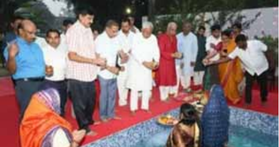
अर्घ्य देते मुख्यमंत्री नीतीश कुमार

बिहार की राजधानी आज सुबह आस्था और भक्ति के रंग में रंगी रही। छठ महापर्व के अंतिम दिन लाखों श्रद्धालुओं ने उगते सूर्य को अर्घ्य देकर चार दिवसीय पर्व का समापन किया। दीघा घाट, गंगा घाट, कंगना घाट सहित शहर के सभी प्रमुख घाटों पर व्रतियों की भीड़ उमड़ पड़ी। महिलाएं पारंपरिक वस्त्रों में सजीं और परिवारजन संग छठी मैया से सुख-समृद्धि की कामना की।केंद्रीय मंत्री धर्मेन्द्र प्रधान, बिहार भाजपा अध्यक्ष दिलीप जायसवाल और जेडीयू के राष्ट्रीय कार्यकारी अध्यक्ष संजय कुमार झा ने भी पूजा-अर्चना में भाग लिया। सभी ने उगते सूर्य