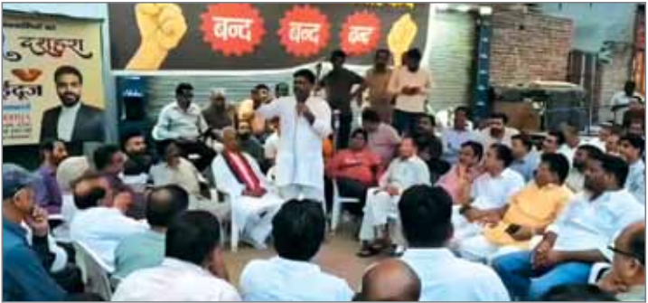
शास्त्रीनगर में 1468 अवैध निर्माण चिन्हित

मेरठ (एजेंसी)। शहर की सेंट्रल मार्केट स्थित भवन संख्या 661/6 के ध्वस्तीकरण के बाद से मेरठ के व्यापारी खोफ में हैं। अवैध निर्माणों पर सुप्रीम कोर्ट के सख्त निर्देशों के बाद अब आवास एवं विकास परिषद ने पूरे शहर में एक बड़ा अभियान शुरू कर दिया है। सोमवार को इस कार्रवाई की आंच माधवपुरम, जागृति विहार और सेंट्रल मार्केट के अन्य हिस्सों तक पहुंची। परिषद ने 150 से अधिक आवंटियों को नोटिस जारी करते हुए 15 दिन में व्यावसायिक गतिविधियां बंद करने का आदेश दिया है। तय समय में कार्रवाई न होने पर सीलिंग और ध्वस्तीकरण की चेतावनी दी गई है। वहीं, व्यापारियों ने भी अब आर-पार की लड़ाई का ऐलान कर दिया है। सेंट्रल मार्केट में जैना ज्वेलर्स का शोरूम 22 सितंबर को शुरू हुआ था।