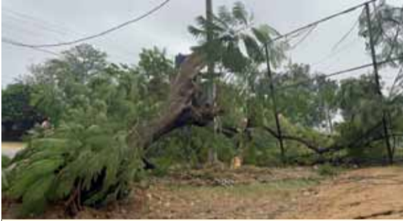
एनएच पर गिरा गुलमोहर का पेड़