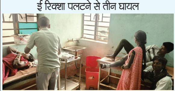
घायलों का इलाज करते चिकित्सक