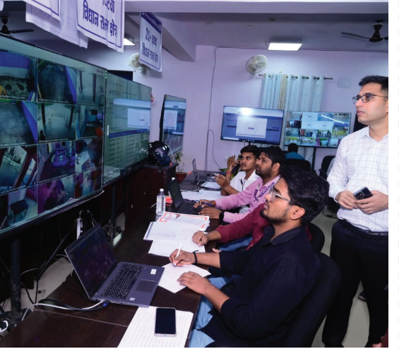
बीएनएम @ मोतिहारी

कंट्रोल रूम के माध्यम से आज के मतदान की संपूर्ण गतिविधि की जानकारी रखी जा रही है। ज्ञातव्य है कि जिला के सभी मतदान केंद्रों पर दो-दो