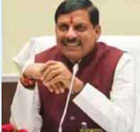
डॉ. मोहन यादव

मध्य प्रदेश आज अपनी स्थापना के 70वें वर्ष में प्रवेश कर रहा है। 01 नवंबर 1956 को अस्तित्व में आये मध्य प्रदेश में विकास की नई यात्रा विगत दो दशकों से आरंभ हुई, जो प्रदेश को देश में अग्रणी राज्य बनाने की संभावनाओं तक पहुंच गई है। यह सुखद संयोग है कि आज देवउठनी ग्यारस के पावन अवसर पर राज्योत्सव का आयोजन किया जा रहा है। हमारे तीज, त्यौहार और परंपराएं हमारी संस्कृति का आधार हैं। उत्सव के आनंद से ही भविष्य निर्माण के भाव निर्मित होते हैं। मुझे यह बताते हुए प्रसन्नता है कि प्रदेश में सभी त्यौहारों को व्यापक स्वरूप में मनाया जा रहा है। अपने त्यौहारों का सांस्कृतिक संदर्भ ही हमें पुरातन से नूतन की प्रेरणा देता है। हमारे लिए गर्व की बात है कि भारत का हृदय मध्य प्रदेश वन, जल, अन्न, खनिज,