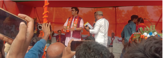
सभा को संबोधित करते सांसद रवि किशन