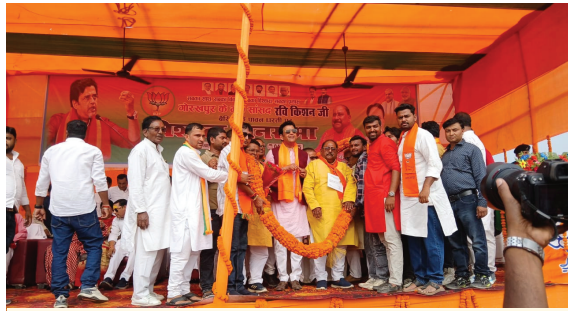
माला पहनाकर स्वागत करते कार्यकर्ता

बैरिया प्रखंड के शहीद भगत सिंह खेल मैदान में मंगलवार को आयोजित एक विशाल जनसभा में गोरखपुर के सांसद व भाजपा के स्टार प्रचारक रवि किशन ने कहा कि एनडीए सरकार के कार्यकाल में बिहार की तस्वीर बदल चुकी है। उन्होंने कहा कि अब बिहार की सूरत बदल रही है और सुदूर क्षेत्रों में भी संपूर्ण विकास हो रहा है। एनडीए सरकार ने गरीबों, माताओं-बहनों और युवाओं के उत्थान के लिए कई योजनाएं शुरू की हैं। बुजुर्गों को जहां पहले 400 पेंशन मिलती थी, वहीं अब 1100 दिए जा रहे हैं। महिलाओं को आत्मनिर्भर बनाने के लिए 10,000 की सहायता राशि दी जा रही है ताकि वे रोजगार कर सकें। उन्होंने बताया कि गरीब परिवारों को 5 लाख तक मुफ्त