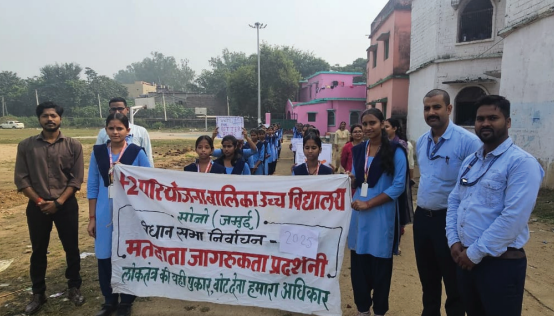
जागरूकता रैली में शामिल छात्रा व शिक्षक