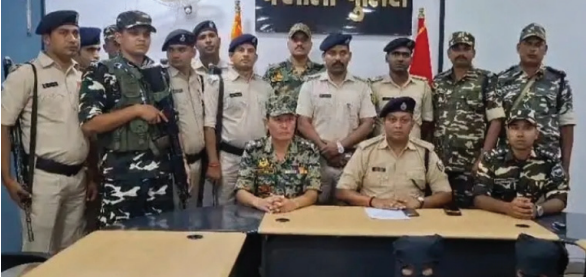
प्रेस वार्ता कर जानकारी देते पुलिस पदाधिकारी

बिहार विधानसभा चुनाव से ठीक पहले वैशाली पुलिस ने बड़ी कार्रवाई करते हुए हाजीपुर के गंगाब्रिज थाना क्षेत्र स्थित सैफपुर गांव में संचालित एक मिनी गन फैक्ट्री का पर्दाफाश किया है। पुलिस और अर्धसैनिक बलों की संयुक्त छापेमारी में भारी मात्रा में देशी कट्टे, जिंदा कारतूस, बारूद और हथियार निर्माण की सामग्री बरामद की गई है। मौके से दो युवकों को गिरफ्तार किया गया है, जिनसे पूछताछ जारी है।पुलिस सूत्रों के अनुसार, यह अवैध फैक्ट्री पिछले तीन से चार महीनों से सक्रिय थी। शुरुआती जांच में खुलासा हुआ है कि यहां बने देशी हथियार पटना और आसपास के जिलों में सप्लाई किए जा रहे थे। अब तक लगभग 10 से अधिक हथियारों की बिक्री की पुष्टि हुई है।