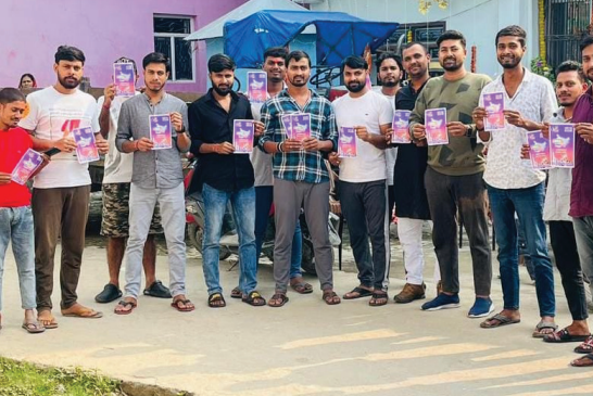
बीएनएम @ गोविंदगंज/अरेराज