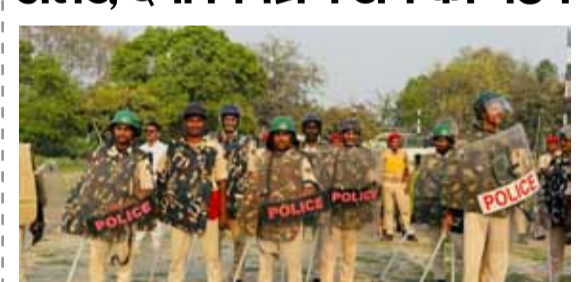
बीएनएम @ बेतिया

बेतिया। आगामी ईद, चैती छठ एवं रामनवमी पर्व को लेकर पश्चिम चंपारण पुलिस पूरी तरह सतर्क हो गई है। पुलिस अधीक्षक शौर्य सुमन के निर्देश पर आपात स्थिति में त्वरित कार्रवाई सुनिश्चित करने के लिए दंगा नियंत्रण टीम का गठन किया गया है। गुरुवार को पुलिस केन्द्र बेतिया के मैदान में गठित टीम द्वारा मॉक ड्रिल का अभ्यास किया गया। इस दौरान टीम के सभी पदाधिकारियों एवं कर्मियों को हेलमेट, बॉडी प्रोटेक्टर, चेस्ट गार्ड, लाठी एवं टियर गैस से लैस किया गया। पुलिस अधीक्षक शौर्य सुमन ने बताया कि यह टीम 24x7 सक्रिय रहेगी और किसी भी आपात स्थिति, दंगा या विधि-व्यवस्था की समस्या उत्पन्न होने पर तत्काल मौके पर पहुंचकर स्थिति को नियंत्रित करेगी। बेतिया पुलिस ने आम लोगों से शांति एवं सौहार्द बनाए रखने की अपील करते हुए कहा है कि प्रशासन आपकी सेवा और सुरक्षा के लिए हमेशा तत्पर है।