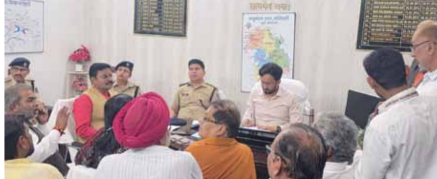
सादे लिवास में पुलिसकर्मियों की तैनाती की गई है। इसके अतिरिक्त, जुलूस की गतिविधियों पर नजर रखने के लिए ड्रोन कैमरों का भी उपयोग किया जाएगा। जिला निबंधक कक्ष से पूरे जिले की गतिविधियों पर लगातार निगरानी रखी जाएगी।असामाजिक तत्वों पर

मोतिहारी। रामनवमी पर्व को शांतिपूर्ण एवं सौहार्दपूर्ण वातावरण में संपन्न कराने हेतु अनुमंडल स्तरीय शांति समिति की बैठक आयोजित की गई। बैठक में विधि-व्यवस्था बनाए रखने के लिए कई महत्वपूर्ण निर्णय लिए गए और आम जनता के लिए दिशा-निर्देश जारी किए गए।अनुमंडल पदाधिकारी ने बताया कि रामनवमी जुलूस के दौरान किसी भी प्रकार का नशा करने वाले व्यक्तियों के विरुद्ध कड़ी कार्रवाई की जाएगी। साथ ही, जुलूस में भाला, गड़ासा एवं अन्य धारदार हथियार लेकर चलने पर पूर्ण प्रतिबंध रहेगा। सुरक्षा व्यवस्था को मजबूत करने के लिए जिला प्रशासन द्वारा जगह-जगह