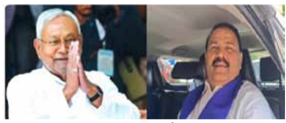
बीएनएम @ पटना

पटना। बिहार की बदलती राजनीतिक परिस्थितियों के बीच सासाराम से कांग्रेस सांसद मनोज राम ने मुख्यमंत्री बदलने की प्रक्रिया पर कड़ा प्रहार किया है। उन्होंने इस नेतृत्व परिवर्तन को जनता के जनादेश के साथ सीधा विश्वासघात करार दिया। सांसद ने कहा कि एनडीए ने पिछला चुनाव नीतीश कुमार के चेहरे पर लड़ा था, ऐसे में बीच कार्यकाल में चेहरा बदलना मतदाताओं के साथ अन्याय है। उन्होंने तंज कसते हुए कहा कि अभी तो एक बार चेहरा बदला गया है, भविष्य में न जाने कितनी बार और बदलाव देखने को मिलेंगे। इस सियासी उठापटक के बीच, भाजपा विधायक दल की बैठक में सम्राट चौधरी को मुख्यमंत्री बनाने की चर्चाएं तेज हैं। माना जा रहा है कि भाजपा की ओर से दो उपमुख्यमंत्री शपथ ले सकते हैं। इस दौरान मनोज राम ने डॉ. बी.आर. अंबेडकर की जयंती पर बाबा साहेब को याद करते हुए उनके संवैधानिक मूल्यों को आत्मसात करने पर जोर दिया। बिहार की यह नई सियासी बिसात अब एक बड़े बदलाव की ओर इशारा कर रही है।