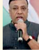
बिहार ने उल्लेखनीय उपलब्धि हासिल की है। सरकारी नौकरियों में महिलाओं को आरक्षण देने और पुलिस बल में उनकी बड़े पैमाने पर बहाली के फैसले को प्रशासनिक और सुरक्षा व्यवस्था में महिलाओं की भागीदारी को मजबूती दी है। वर्ष 2013 में पुलिस बल में 35 प्रतिशत आरक्षण लागू करने के बाद आज बिहार में महिला पुलिसकर्मियों की संख्या देश में सबसे अधिक बताई जा रही है। इसके साथ ही ‘जीविका’ योजना के माध्यम से लाखों महिलाओं को स्वयं सहायता समूहों से