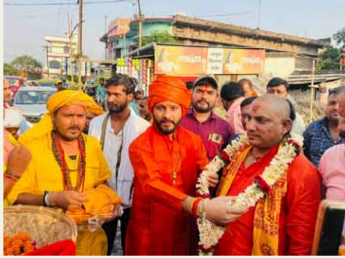
महाराज ने अत्यंत भावुक और प्रेरणादायी विचार साझा किए। उन्होंने कहा कि आज अरेराज की धरती के लिए यह अत्यंत सौभाग्य और गौरव का विषय है कि उसे इस महान यात्रा की मेजबानी करने का अवसर प्राप्त हुआ है। महाराज जी ने इस