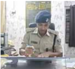
29 लाख रुपए इन्वेस्ट कर दिए। ये रुपए उसने अपनी बहन की शादी के लिए जमा किए थे। पीड़ित ने साहबराम में मामले की शिकायत की है।

पटना में एक युवक (27) से 29 लाख की ठगी हुई है। डेटिंग ऐप 'SCHMOOZE' पर पीड़ित की एक लड़की से पहचान हुई थी। पीड़ित को उस लड़की ने अपना नाम रैचल बताया था। कुछ दिनों में दोनों ने एक-दूसरे का व्हाट्सएप नंबर एक्सचेंज किया। व्हाट्सएप पर दोनों बातें करते थे। एक दूसरे की तस्वीरें और वीडियो शेयर किया करते थे। लड़की ने युवक को ठगने की प्लानिंग पहले से बना रखी थी, पर पीड़ित को नहीं पता था कि उसके साथ ऐसा हो सकता, वो तो ये सोचता रहा कि वो लड़की उससे प्यार करती है। कुछ ही दिन में शादी तक बात पहुंच गई। लड़की ने कहा कि रिश्ता आगे बढ़ाने से पहले तुम इन्वेस्टमेंट कर लो। जिसके बाद पीड़ित तैयार हो गया। बस यहीं उससे गलती हो गई। लड़के ने 6 दिसंबर 2025, 20 जनवरी 2026 और 2 मार्च 2026 को तीन बार में