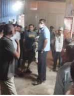
घुमारा। इसी बीच कारोबारी ने अपने पार्टनर को फोन कर के रुपये लाने के लिए कहा। पार्टनर ने इंस्पेक्टर से बात की और डिमांड के रूप देने को लेकर राम कृष्ण नगर इलाके के खेमनी चक में बुलाया। कारोबारी के पार्टनर ने इंस्पेक्टर से शर्त रखी कि वही नहीं आएंगे। रुपए लेने सादे लिबास में आएंगे।

पटना में खेमनी चक मोड पर एक इंस्पेक्टर और कोयला कारोबारी के बीच गाली-गलौज और हंगामा हुआ। इस दौरान लोगों की भीड़ भी जुटी रही। दरअसल, कोयलाही इलाके के मौर्या लोक के पास कोयला कारोबारी किसी काम के से पहुंचे थे। उन्होंने अपनी गाड़ी पास में ही खड़ी की थी। काम पूरा होने के बाद कारोबारी गाड़ी में आकर बैठे तब तक साइबर थाने में पदस्थानीक एक इंस्पेक्टर वहीं में आए और उसे पकड़ लिया। कोयला कारोबारी के दोस्त का आरोप है कि पकड़ने के बाद उन्होंने कारोबारी के मोबाइल फोन ले लिए। गाड़ी की चाबी निकाल ली। इसके बाद केस में फंसाने की धमकी देकर 50 लाख रूपए की डिमांड करने लगे। दो घंटे तक शहर में घुमारा: दोस्त ने बताया, तकरीबन एक से दो घंटे तक उसी गाड़ी से शहर में