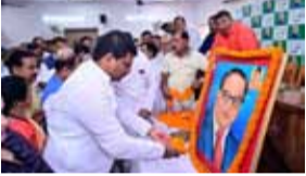
इसके माध्यम से शिक्षा, रोजगार, आवास एवं सामाजिक सुरक्षा से संबंधित अनेक जनकल्याणकारी योजनाओं को प्रभावी ढंग से लागू किया गया। वर्ष 2007 में अनुसूचित जाति एवं जनजाति कल्याण विभाग का स्वतंत्र रूप से गठन किया गया। साथ ही, राज्य अनुसूचित जाति एवं जनजाति आयोग की स्थापना कर इन समुदायों के उत्थान की दिशा में महत्वपूर्ण पहल की गई।