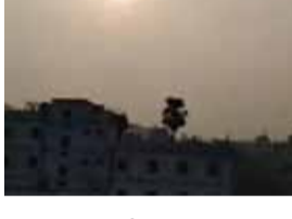
स्ट्रीम हवाएं, लेकिन सतह पर गर्मी हवी। इन सभी कारणों से नमी घटी और तापमान बढ़ा।

राजधानी समेत राज्यभर में मौसम बदला हुआ है। पटना मौसम केंद्र के मुताबिक 18 अप्रैल के बाद दक्षिण और मध्य बिहार के कई जिलों में पारा 4 डिग्री तक बढ़ेगा, जिससे अधिकतम तापमान 40 के पार जाने की संभावना है। गयाजी, औरंगाबाद, रोहतास, कैमूर, नवादा, बक्सर समेत कई जिलों में हीट वेव की स्थिति बनेगी। अगले 7 दिनों तक अधिकांश जिलों में बारिश की संभावना नहीं है। अररिया, किशनगंज, पूर्णिया और कटिहार में एक-दो जगह हल्की बारिश संभव है। वर्षों बढ़ रही गर्मी: पूर्व-पश्चिम और उत्तर-दक्षिण टुफ लाइनें राज्य से गुजर रही। पश्चिमी विक्षोभ कमजोर, इसलिए ठंडा असर नहीं मिल रहा। ऊपर के स्तर पर तेज जेट