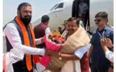
का दावा पेश करने के लिए राजभवन जाएंगे।