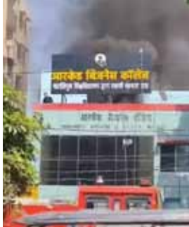
25 लोगों का रेस्क्यू, दमकल की 3 से ज्यादा गाड़ियों ने बुझाई लपटें

पटना के दिनकल गोलंबर के पास आर्केड बिजनेस कॉलेज में आग लग गई है। मौके पर अफरा-तफरा की स्थिति बनी है। धुआं देखकर आसपास के लोगों की भीड़ जुट गई है। लोग अपने स्तर से आग बुझाने की कोशिश कर रहे हैं। अगलगी की वजह शॉर्ट-सर्किट बतायी जा रही है। फिलहाल मौके पर दमकल की तीन गाड़ियां पहुंच चुकी है। घटना कदमकुआं इलाके की है।