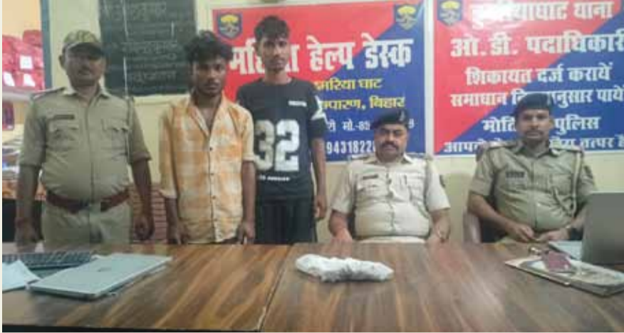
बोलेरो गाड़ी से पहुंचे बदमाशों के गिरोह पर छापेमारी की, जिसमें दो अपराधियों को गिरफ्तार कर कार्रवाई करते हुए पुलिस ने

» पुलिस को आता देख आधा दर्जन अन्य बदमाश भौगोलिक स्थिति का लाभ उठाकर फरार » पकड़े गए बदमाशों ने पुलिस के समक्ष कई अहम राज उगले, भाग निकले साथियों के नाम का किया खुलासा