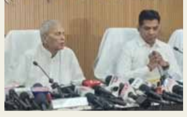
और डिजिटल व्यवस्था को दर्शाता है।