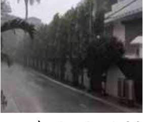
संभावना है। वहीं, बाकी 25 जिलों में भीषण गर्मी लोगों को परेशान करेगी। इधर, दक्षिण बिहार में भीषण गर्मी को देखते हुए नालंदा और बक्सर में स्कूल और सभी शैक्षणिक संस्थाओं के टाइमिंग में बदलाव किया गया है। गर्मी को सरकार की तरफ से बसों के लिए गाइडलाइन जारी किया गया है। अब बसों सर्वजनिक बसों में यात्रियों के लिए पाने का पानी, ORS और फर्स्ट ऐड किट रखना अनिवार्य कर दिया है। नालंदा में 1 से 8वीं तक के सभी सरकारी और प्राइवेट स्कूल और आंगनबाड़ी केंद्र 12.30 बजे तक ही चलेंगे।

बिहार इस समय मौसम के दोहरे मिजाज से जूझ रहा है। एक तरफ दक्षिण बिहार में भीषण गर्मी है, तो दूसरी तरफ सीमांचल में आंधी, बारिश और आकाशीय बिजली ने तबाही मचाई है। रोहतास का डेहरी 43.2 डिग्री तापमान के साथ सबसे गर्म रहा। कैमूर में भी पारा 43 डिग्री तक पहुंच गया, जबकि 8 जिलों का तापमान 40 डिग्री के पार दर्ज किया गया। भोजपुर में गर्मी की चपेट में आने से एक महिला की मौत हो गई। वहीं, बिहार के अलग-अलग जिलों में आंधी-बारिश और उनका गिरने से 5 लोगों की जान चली गई। रक्सौल, मधुबनी समेत 10 जिलों में बारिश हुई, जबकि सुपौल, कटिहार और अररिया में दर्जनों घर क्षतिग्रस्त हो गए। मौसम विभाग ने आज भी 3 जिलों में आंधी-बारिश को लेकर ऑरेंज अलर्ट जारी किया है। इन जिलों में 50 किमी/घंटा की रफ्तार से तेज हवा चलने की