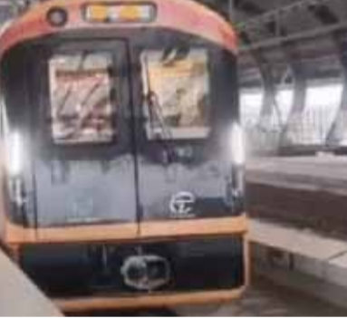
इस दौरान सिग्नलिंग सिस्टम को कैप्टिसिटी, ब्रेकिंग सिस्टम का प्रदर्शन, ट्रैक और ओवरहेड इलेक्ट्रिफिकेशन सिस्टम, स्टेशन समन्वय और संचार व्यवस्था, आपातकालीन सुरक्षा प्रोटोकॉल, ट्रेन को निर्धारित अधिकतम गति तक चलाकर सभी सुरक्षा मानकों का परीक्षण किया गया था।