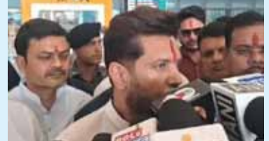
यह ध्यान रखना चाहिए कि किसी ऐसे परिवार का घर न तोड़ा जाए जिसका उस जमीन पर वैध अधिकार हो। उनके मुताबिक कार्रवाई के नाम पर गरीब और जरूरतमंद लोगों को परेशान नहीं किया जाना चाहिए। गरीबों के लिए पहले हो वैकल्पिक व्यवस्था: चिराग पासवान ने कहा कि उनकी पार्टी हमेशा से यह मांग करती रही है कि यदि किसी गरीब परिवार का घर हटया जाता है, तो पहले उनके रहने की वैकल्पिक व्यवस्था की जाए। उन्होंने स्पष्ट कहा कि बिना पुनर्वास की व्यवस्था किए किसी का आशियाना उजाड़ना

केंद्रीय मंत्री चिराग पासवान ने बिहार में चल रहे बुलडोजर एक्शन और शराबबंदी कानून पर प्रतिक्रिया दी। उन्होंने कहा, अवैध तरीके से बने मकानों पर कार्रवाई होनी चाहिए, लेकिन इस दौरान यह भी सुनिश्चित किया जा कि किसी गरीब और हकदार परिवार के साथ अन्याय न हो। साथ ही उन्होंने शराबबंदी कानून की मंशा को सही बताते हुए इसके क्रियान्वयन में सुधार की जरूरत पर जोर दिया। बुलडोजर कार्रवाई पर संतुलित रुख: बिहार सरकार के अवैध अतिक्रमण हटाने के लिए चलाए जा रहे बुलडोजर अभियान पर प्रतिक्रिया देते हुए चिराग पासवान ने कहा कि जो भी मकान या निर्माण अवैध तरीके से सरकारी जमीन पर किए गए हैं, उन पर कार्रवाई जरूरी है। उन्होंने मकान कि राज्य सरकार को अतिक्रमण के खिलाफ सख्त रुख अपनाने का अधिकार है। हालांकि, उन्होंने यह भी कहा कि प्रशासन को