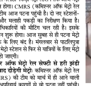
मेट्रो की टीम द्वारा पहला ट्रायल किया गया था। पटना मेट्रो पहली बार शहर के अंदर दौड़ी थी। भूतनाथ से मलाही पकड़ी तक 2.75 किमी में मेट्रो का ट्रायल रन किया गया था।

भूतनाथ से मलाही पकड़ी मेट्रो स्टेशन तक आज मेट्रो का ट्रायल रन होगा। CMRS (कमिश्नर ऑफ मेट्रो रेल सेप्टी) की टीम आज पटना पहुंची है। दो नए स्टेशन-खेमनीचक और मलाही पकड़ी का निरीक्षण किया है। फिलहाल अधिकारियों की मीटिंग चल रही है। इसके बाद ट्रायल रन शुरू होगा। आज सुबह से ही पटना मेट्रो आम पब्लिक के लिए बंद है। मंगलवार से पाटलिपुत्रा बस टर्मिनल मेट्रो स्टेशन से फिर से यात्रियों के लिए मेट्रो सेवा बहाल हो जाएगी। कमिश्नर ऑफ मेट्रो रेल सेप्टी से हरी झंडी मिलने के बाद दौड़ेगी मेट्रो: कमिश्नर ऑफ मेट्रो रेल सेप्टी (CMRS) की टीम को मार्च में ही आने वाली थी, लेकिन अपरिहार्य कारणों से वो पटना नहीं पहुंची। CMRS की हरी झंडी मिलने के बाद ही आगे मेट्रो दौड़ेगी। दो नए स्टेशनों का उद्घाटन मुख्यमंत्री द्वारा किया जाएगा। इस दौरान टीम मलाही पकड़ी और खेमनीचक स्टेशन के ट्रैक, सिग्नलिंग सिस्टम, प्लेटफॉर्म सुरक्षा व्यवस्था, यात्री सुविधाएं और अन्य तकनीकी पहलुओं की बारीकी से जांच करेगी। सभी तकनीकी और सुरक्षा मानकों पर खरे उतरने के बाद उद्घाटन की तारीख तय होगी। भूतनाथ से मलाही पकड़ी तक हुआ था ट्रायल: मेट्रो का भूतनाथ से मलाही पकड़ी तक 26 फरवरी को