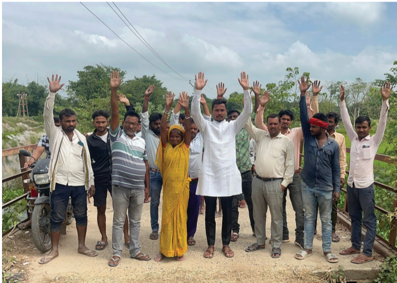
कि यह पुल बेलाही राम, फेनहारा, कालू पकड़ी और मड़पा समेत कई गांवों को जोड़ने वाला महत्वपूर्ण संपर्क मार्ग है। इसी रास्ते से प्रखंड मुख्यालय, शिवहर और मधुवन आने-जाने वाले सैकड़ों छोटे-बड़े वाहन प्रतिदिन गुजरते हैं। ऐसे में पुल की जर्जर स्थिति कभी भी बड़े हादसे का

पताही। प्रखंड क्षेत्र के बेलाही राम गांव में स्थित जर्जर लोहे का पुल इन दिनों लोगों के लिए बड़ी परेशानी और खतरे का कारण बना हुआ है। पुल की रेलिंग पूरी तरह टूट चुकी है, जबकि पुल के समीप स्थित घुमावदार मोड़ के कारण हर समय दुर्घटना की आशंका बनी रहती है। स्थानीय ग्रामीणों ने नए पुल निर्माण एवं अविलंब मरम्मत की मांग को लेकर विरोध प्रदर्शन कर प्रशासन से शीघ्र कार्रवाई की अपील की है। ग्रामीणों का कहना है कि यह पुल बेलाही राम पंचायत के मुख्य मार्ग पर एक नाले के ऊपर बना हुआ है और इसकी स्थिति वर्षों से खराब बनी हुई है। पुल की रेलिंग टूट जाने से बाइक चालकों, साइकिल सवारों और पैदल यात्रियों को काफी परेशानी का सामना करना पड़ रहा है। खासकर रात के समय यहां दुर्घटना होने का खतरा और अधिक बढ़ जाता है। स्थानीय लोगों ने बताया कि घुमावदार सड़क और जर्जर गिर के कारण कई बार लोग संतुलन खोकर नीचे गिर चुके हैं। इसके बावजूद अब तक न तो पुल की मरम्मत कराई गई और न ही नए पुल निर्माण को लेकर कोई ठोस पहल की गई है। लोगों में इस बात को लेकर नाराजगी देखी जा रही है। बताया जाता है