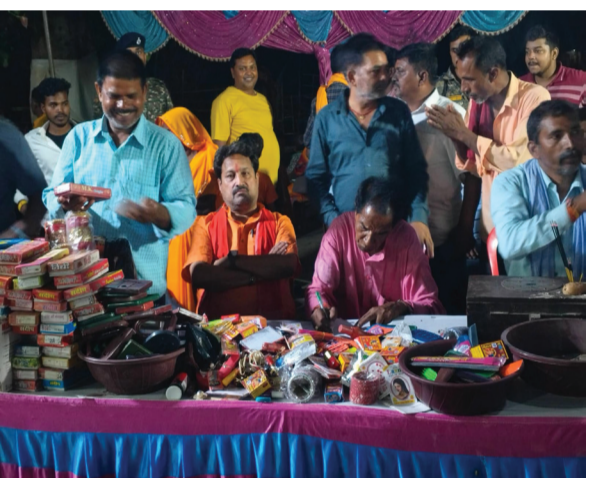
के लिए भोजन एवं अन्य सुविधाओं की बेहतर व्यवस्था की गई थी। ग्रामीणों ने बताया कि इस तरह के सामूहिक विवाह से जल्दतरम परिवारों को काफी सहारा मिलता है और समाज में एकता का संदेश जाता है। कार्यक्रम शांतिपूर्ण माहौल में सफलतापूर्वक संपन्न हुआ।

योगापट्टी: योगापट्टी प्रखंड के मच्छरगांवा स्थित ठाकुर धाम मंदिर परिसर में आयोजित सामूहिक विवाह समारोह में 14 जोड़ी दुल्हा-दुल्हन सात फेरे लेकर वैवाहिक बंधन में बंध गए। पूरे गांव में उत्सव जैसा माहौल देखने को मिला। विवाह समारोह में आसपास के क्षेत्रों से पहुंचे लोगों ने नवविवाहित जोड़ों को आशीर्वाद दिया। कार्यक्रम को लेकर आयोजन समिति एवं ग्रामीणों ने मिलकर भव्य तैयारी की थी। विवाह स्थल को आकर्षक ढंग से सजाया गया था। वैदिक मंत्रोच्चार और रीति-रिवाजों के बीच सभी जोड़ों का विवाह संपन्न कराया गया। समारोह में समाज के कई गणमान्य लोग, जनप्रतिनिधि एवं ग्रामीण उपस्थित रहे। लोगों ने सामूहिक विवाह को सामाजिक सहयोग और भाईचारे की मिसाल बताया। आयोजन समिति द्वारा सभी मेहमानों