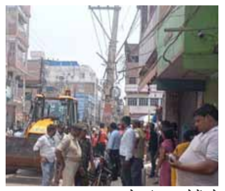
यातायात व्यवस्था सुचारु रखने एवं आम लोगों को सुविधा देने के लिए आगे भी इस तरह का अभियान जारी रहेगा। इस अभियान में यातायात पुलिस ने भी अपनी सहभागिता निभाई।