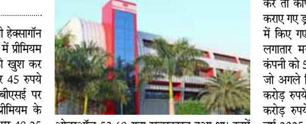
ओवरऑल 53.68 गुना सब्सक्राइब हुआ था। इनमें क्वालिफाइड इंस्टीट्यूशनल बायर्स (क्यूआईबी) के लिए रिजर्व पोर्शन 19.77 गुना सब्सक्राइब हुआ था। वहीं नॉन-इंस्टीट्यूशनल इन्वेस्टर्स (एनआईआई) के लिए रिजर्व पोर्शन में 161.49 गुना सब्सक्रिप्शन आया था। इसी तरह रिटेल इन्वेस्टर्स के लिए रिजर्व पोर्शन 26.85 गुना सब्सक्राइब हो सका था। इस आईपीओ के तहत एक रुपये फेस वैल्यू वाले 3,08,59,704 शेयर ऑफर फॉर सेल विंडो के जरिए जारी किए गए हैं। हेक्सगॉन न्यूट्रिशन की वित्तीय स्थिति की बात

न्यूट्रिशन प्रोडक्ट्स बनाने वाली कंपनी हेक्सगॉन न्यूट्रिशन के शेयरों ने आज स्टॉक मार्केट में प्रीमियम एंटी करके अपने आईपीओ निवेशकों को खुश कर दिया। आईपीओ के तहत कंपनी के शेयर 45 रुपये के भाव पर जारी किए गए थे। आज बीएसई पर इसकी लिस्टिंग लगभग सात प्रतिशत प्रीमियम के साथ 48 रुपये के स्तर पर आ गई। लिस्टिंग पर 48.25 रुपये के स्तर पर हुई। लिस्टिंग के बाद लिवाली के सपोर्ट से ये शेयर उछल कर 50.66 रुपये के अपर सर्किट लेवल तक पहुंच गया। इस तरह पहले दिन के कारोबार में ही कंपनी के आईपीओ निवेशकों को प्रति शेयर 5.66 रुपये यानी 12.58 प्रतिशत का फायदा हो गया। हेक्सगॉन न्यूट्रिशन का 138.87 करोड़ रुपये का आईपीओ पांच से नौ जून के बीच सब्सक्रिप्शन के लिए खुला था। इस आईपीओ को निवेशकों की ओर से शानदार रिस्पॉन्स मिला था, जिसके कारण ये