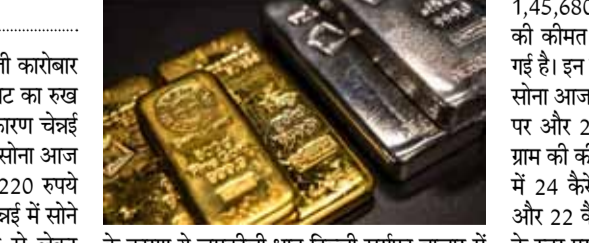
के कारण ये चमकीली धातु दिल्ली सरफा बाजार में आज भी 2,49,900 रुपये प्रति किलोग्राम के स्तर पर बिक रही है। दिल्ली में आज 24 कैरेट सोना 1,45,780 प्रति 10 ग्राम के स्तर पर कारोबार कर रहा है, जबकि 22 कैरेट सोने की कीमत 1,33,640 रुपये प्रति 10 ग्राम दर्ज की गई है। वहीं, देश की आर्थिक राजधानी मुंबई में 24 कैरेट सोना 1,45,630 रुपये प्रति 10 ग्राम और 22 कैरेट सोना 1,33,490 रुपये प्रति 10 ग्राम के स्तर पर बिक रहा है। इसी तरह अहमदाबाद में 24 कैरेट सोने की रिटेल कीमत

घरेलू सरफा बाजार में आज शुरुआती कारोबार के दौरान सोने के भाव में जबरदस्त गिरावट का रुख बना हुआ है। भाव में आई कमजोरी के कारण चेन्नई के अलावा देश के दूसरे सरफा बाजार में सोना आज 2,950 रुपये प्रति 10 ग्राम से लेकर 3,220 रुपये प्रति 10 ग्राम तक सस्ता हो गया। वहीं, चेन्नई में सोने के भाव में 3,000 रुपये प्रति 10 ग्राम से लेकर 3,270 रुपये प्रति 10 ग्राम तक की गिरावट दर्ज की गई। सोना के विपरीत चांदी के भाव में आज कोई बदलाव नहीं हुआ है। भाव में गिरावट के कारण देश के ज्यादातर सरफा बाजार में 24 कैरेट सोना आज 1,45,630 रुपये प्रति 10 ग्राम से लेकर 1,47,270 रुपये प्रति 10 ग्राम के स्तर पर कारोबार कर रहा है। वहीं, 22 कैरेट सोना आज 1,33,490 रुपये प्रति 10 ग्राम से लेकर 1,34,990 रुपये प्रति 10 ग्राम के बीच बिक रहा है। चांदी के भाव में बदलाव नहीं होने