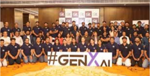
मिला और यह 97.40 रुपये के अपर सर्किट स्तर तक पहुंच गया। इसके बावजूद आईपीओ निवेशकों को प्रति शेयर 18.60 रुपये अथवा 16.03 प्रतिशत का नुकसान झेलना पड़ा। जेनएक्सआई एनालिटिक्स का 54.84 करोड़ रुपये का आईपीओ पांच जून से नौ जून तक निवेशकों के लिए खुला था। कंपनी के इश्यू को निवेशकों का अच्छा समर्थन मिला था और यह कुल 16.99 गुना सब्सक्राइब हुआ था। क्वालिफाइड इंस्टीट्यूशनल बायर्स

आर्टिफिशियल इंटेलिजेंस (एआई) सेक्टर में काम करने वाली कंपनी जेनएक्सआई एनालिटिक्स के शेयरों ने शेर्यार सामने निराशाजनक शुरुआत की। कंपनी के शेयर शुक्रवार को एनएसई के एसएफई प्लेटफॉर्म पर भारी डिस्काउंट के साथ सूचीबद्ध हुए, जिससे आईपीओ निवेशकों को पहले ही दिन नुकसान का सामना करना पड़ा। कंपनी ने अपने आईपीओ के तहत शेयरों का निर्गम मूल्य 116 रुपये प्रति शेयर तय किया था। हालांकि बाजार में इसकी एंटी 20 प्रतिशत डिस्काउंट के साथ 92.80 रुपये पर हुई। कमजोर लिस्टिंग के बावजूद बाद में निवेशकों की खरीदारी बढ़ने से शेयर में कुछ सुधार देखने को