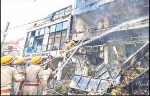
First responders described seeing some survivors smashing windowpanes and using a rope to rappel down to safety

on Usha Mehta Marg in north Lucknow, fed the flames, fire department sources said.